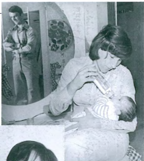
Я кормлю дочь. Редкий кадр.