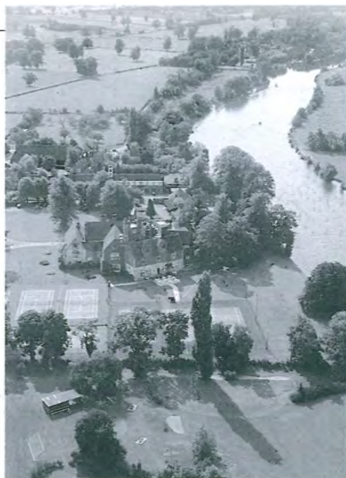
Темза. Марлоу. Бишем-Абби. Райский уголок, где мы поселились.