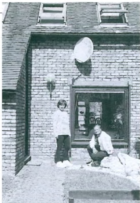
1998 г. С Витей на пороге английского дома.