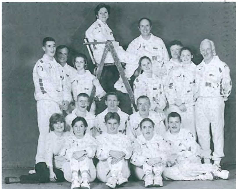
Дружный коллектив преподавателей и учеников центра в Бишем-Абби. Как видите — я на высоте.