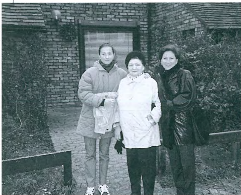
Бабушка у нас в гостях.