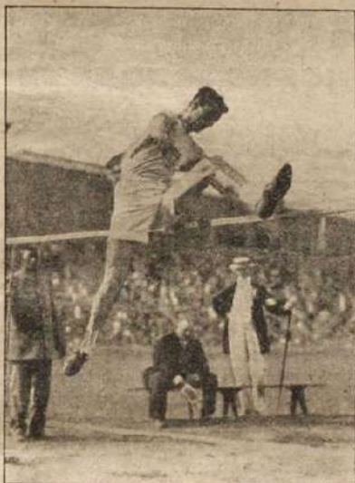
Прыжки въ высоту съ мѣста олимпійца Платъ Адамса,