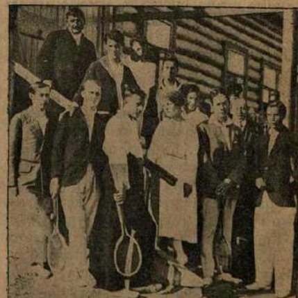
Общая группа теннисистовъ участниковъ состязаній 13-14 сент. въ О-вѣ физ. воспитанія.

Прыжки въ длину съ мѣста: 1) Пономаревъ—2 метра 55,5 сант. (новый рекордъ), 2) Чумаковъ—2 м. 51 с., 3) Чернышевъ—2 м. 47 сант., 4) Калачевъ — 2 метра 46½ сек.