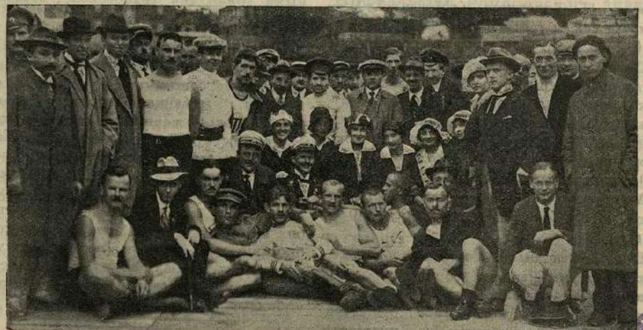
Группа гостей и участниковъ состязаній 2-го августа въ „Моглиствѣ“.

Метаніе диска: 1) Ергинъ (Унитасъ)—34 м. 68 см., 2) Грипенко (Унитасъ) —