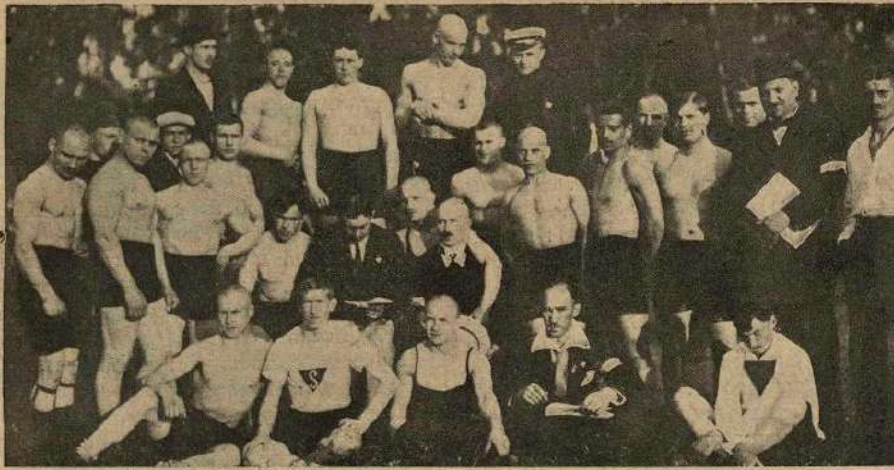
Группа членовъ Московскаго о-ва „Санитасъ“ на открытіи спортивной площадки въ Петровск. паркѣ.

и высоту, съ мѣста и въ прыжкахъ въ длину съ разбѣга.