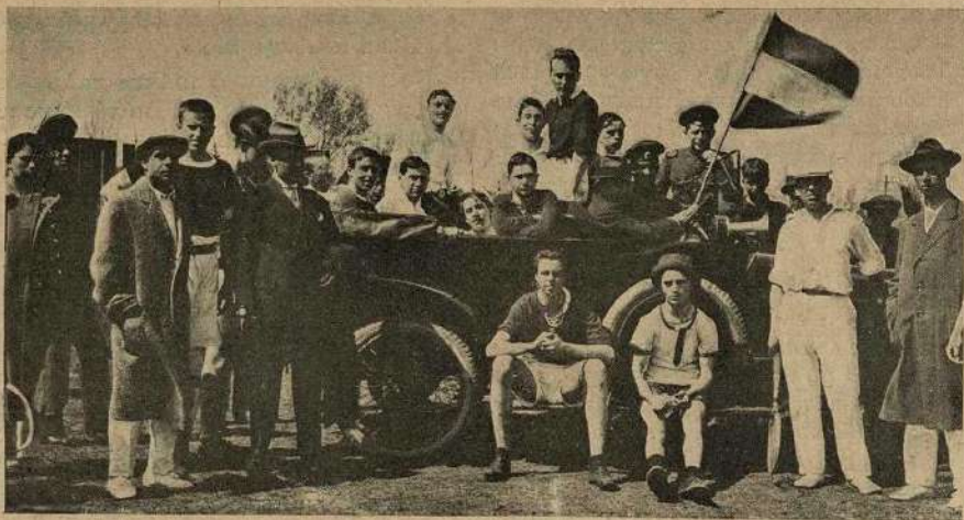
Автомобиль г. Фидрэ, развозящій участниковъ эстафеты Харьков—Помьрки по этапамъ.