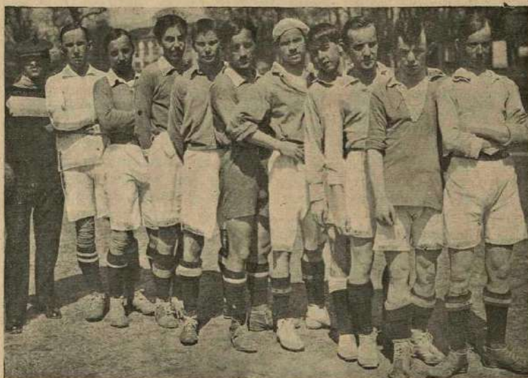
2-я футбольная команда «Уніо».