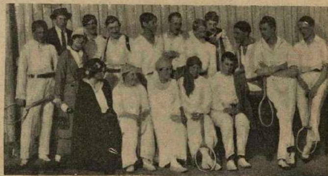
Группа участниковъ лаунъ-тенниснаго состязанія въ М. К. Л.

тельно на 8—9 километровъ. Состязалось всего 3 команды—одна отъ М. К. Л. С., отъ М. К. Л. и отъ Р. С. К.