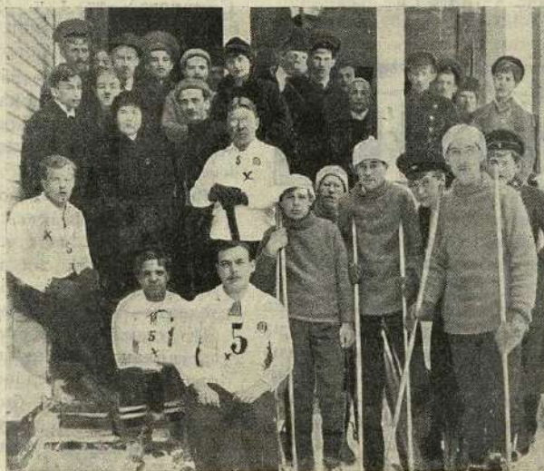
Группа лыжниковъ К. Ф. С. × побѣдители комитетскаго состязанія.

зонъ безъ пораженій, она легко вышла побѣдительницей, оставивъ на второмъ мѣстѣ прошлогоднюю побѣдительницу «Нарву». На третьемъ мѣстѣ, съ одинаковымъ количествомъ очковъ, остались «Конькобѣжцы» и «Унитасъ» въ виду этого сыгравшіе между собой матчъ, выигранный съ небольшимъ преимуществомъ въ одинъ мячъ, «Конькобѣжцами», занявшими такимъ образомъ третье мѣсто,—на четвертомъ и на последнемъ остался «Унитасъ». Въ группѣ Б играли: Спортивное о-во «Унионъ», Петроградскій кружокъ любителей спорта («Спортъ»), Павловско-Гарлевскій кружокъ любителей спорта («Павловскъ») и Петровскій кружокъ