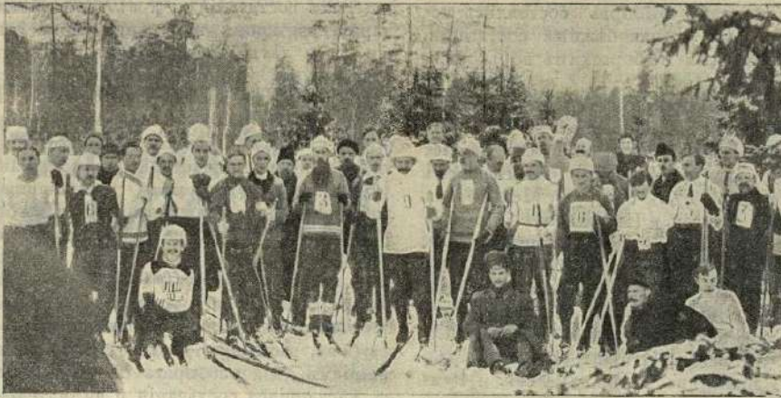
Общая группа участников лыжнаго состязанія на комитетскій призъ.