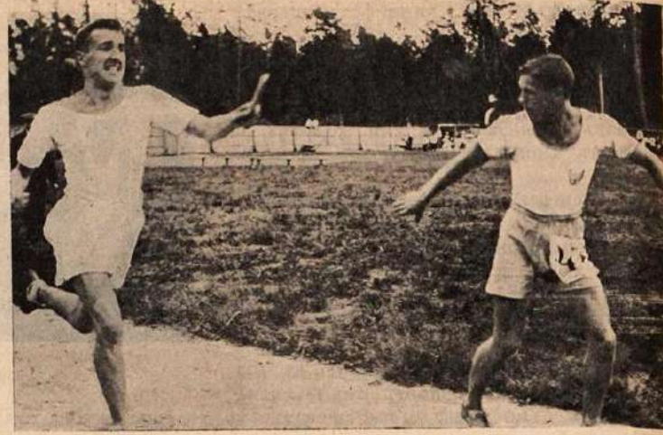
Лиговое состязаніе въ И. К. С. 15 го іюня 1914 г.—Смѣна эстафеты въ бѣгѣ на 1500 метровъ.

кортъ 39 мет. 50 сан.). Бирнѣкъ («Марсъ») 36 мет. 52 сан. Киббильдъ («Марсъ») 34 мет. 54 сан.