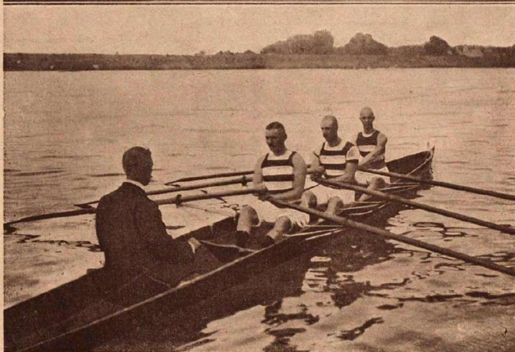
Состязанія въ ИМПЕРАТОРСКОМЪ Московскомъ рѣчномъ яхтъ-клубѣ 8 іюня 1914 г.— Четверка и тройка, заняшія первыя мѣста.