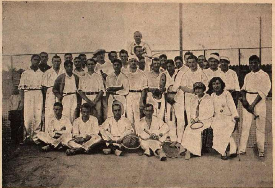
Группа участниковъ закрытыхъ лаунъ-теннисныхъ состязаній въ Харьковскомъ обществѣ „Финиксъ“. Съ фот. С. А. Растроргуевъ.

Императорскій кубокъ остается вѣчной собственностью всероссійскаго союза. Выигравшій въ послѣднемъ кругу матчей, и тѣмъ образомъ побѣдитель, получаетъ золотую медаль, изготовляемую на средства всероссійскаго союза. Имя побѣдителя вырѣзывается на Императорскомъ кубкѣ, съ означеніемъ года выигрыша. Проигравшему въ послѣднемъ кругу выдается серебряная медаль.