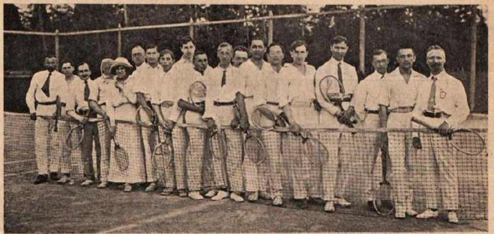
Группа участниковъ и судей закрытыхъ лаунъ-теннисныхъ состязаній въ О. Л. Л. С.

4 и 5 мая на полѣ Симферопольскаго Гимнастическаго Общества состоялся второй въ текущемъ сезонѣ междугородный матчъ въ футболъ. Спортивными противниками на этотъ разъ выступали 1 команда Кіевскаго Политехническаго Института и 1 команда С. Г. О. Побѣдителямъ состязанія между прочимъ предназначался и тотъ призъ, который остался неразыграннымъ послѣ встрѣчи С. Г. О. съ харьковскимъ «Фениксомъ». Какъ извѣстно, игра тогда свелась въ ничью и теперь выигрышъ кубка предоставлялся уже Кіеву. Открывается матчъ при совершенно неблагоприятныхъ условіяхъ: погода дождливая, поле грязное, игра трудная. Съ мѣста обѣ команды