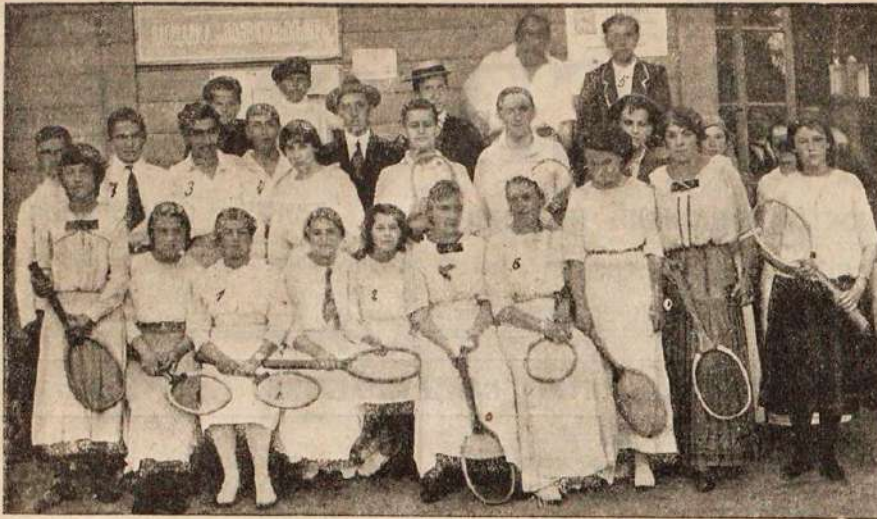
Участники состязаній въ лаунъ-теннисъ на площадкѣ О. Ф. В.

Вопросъ этотъ неоднократно разбирался и съ психологической, и съ эстетической, и съ физиологической точекъ зрѣнія и послужилъ поводомъ къ цѣлому ряду интересныхъ теорій и гипотезъ.