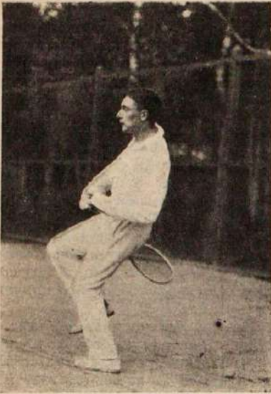
Госсъ I. Побѣдитель въ gentl. club handicap singl.

Марсель и Парижъ онъ предполагаетъ вернуться въ Петербургъ.