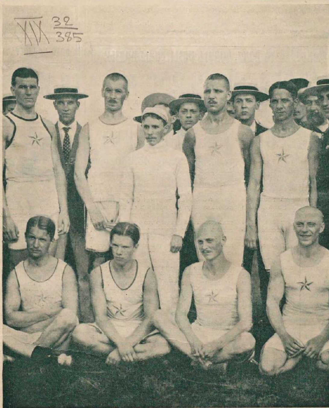
Команда восьмерки Шуваловскаго гребного общества „Фортуна“, взявшая Императорскій призъ на большой союзной гонкѣ въ Петербургѣ 7-го іюля 1913 г.