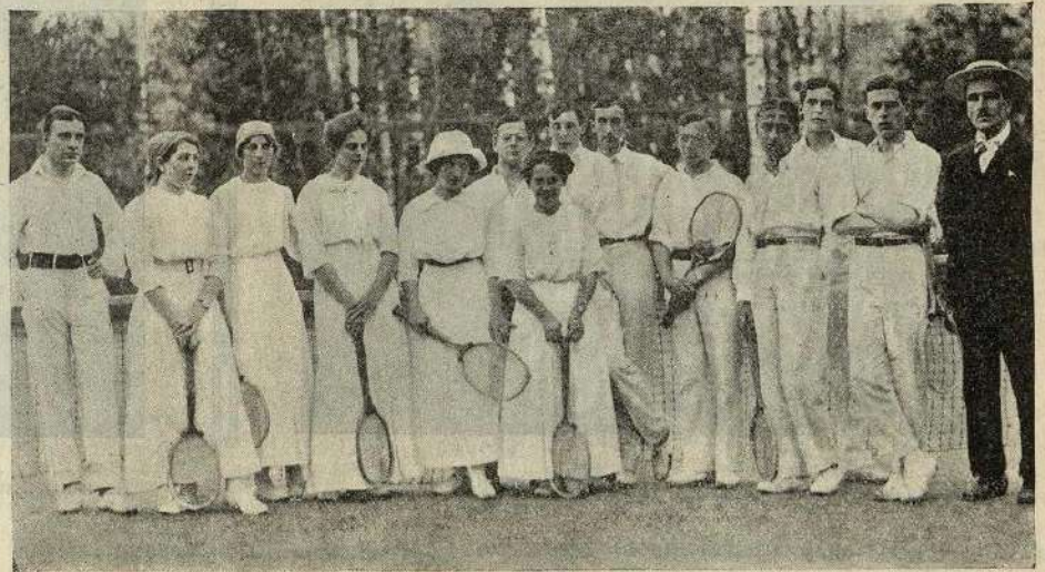
Группа участниковъ состязаній.