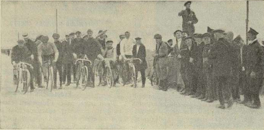
Старт 15-верстной гонки въ Московскомъ кружкѣ конькобѣжцевъ и велосипедистовъ-любителей.