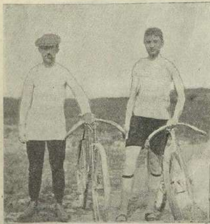
Велосипедно-моторныя гонки въ М. К. К. и В.-Л. [Взяшіе 1-й и 2-й призы на 10-верстной гонкѣ.]