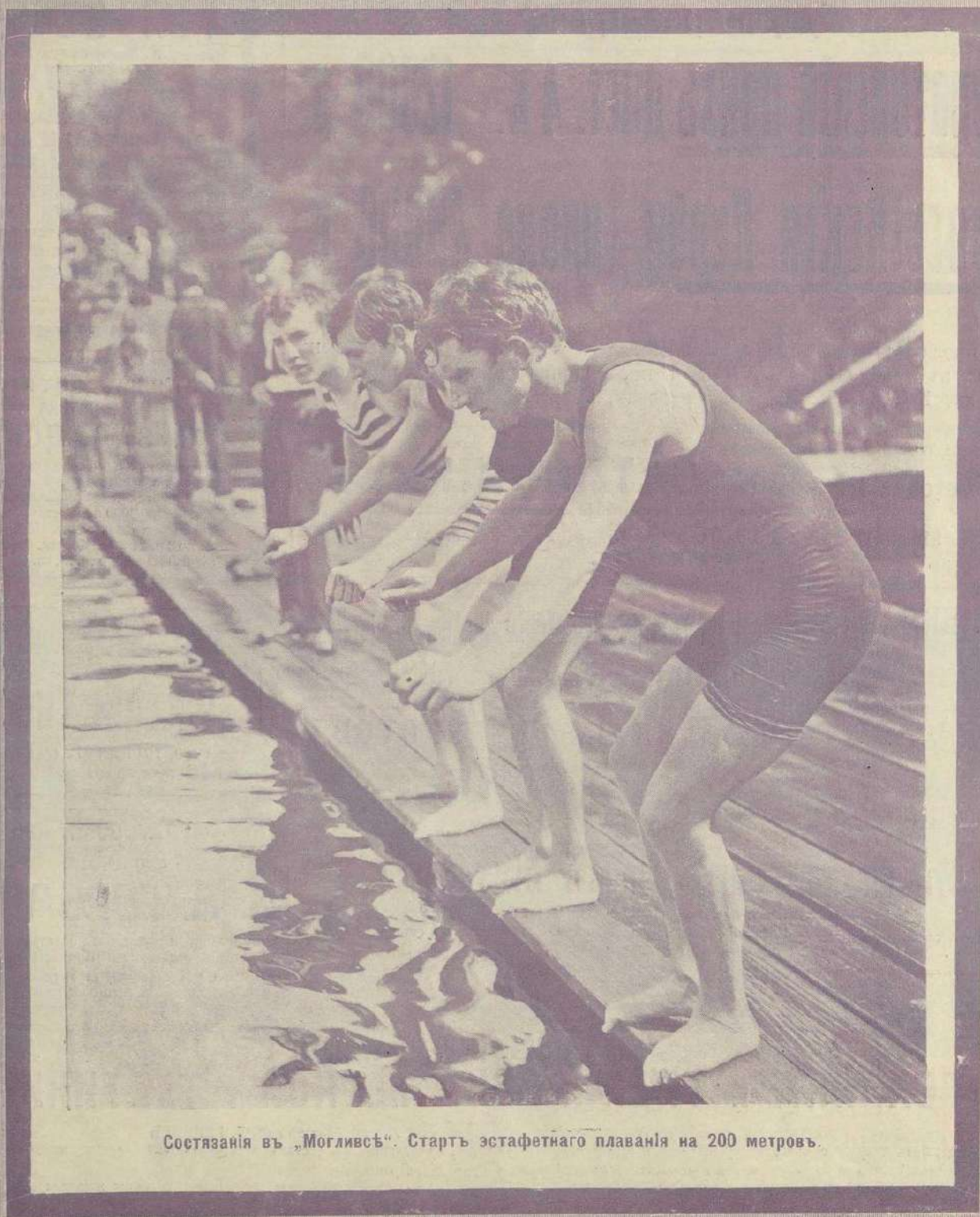
Состязанія въ „Могливіѣ“. Стартъ эстафетнаго плаванія на 200 метровъ.