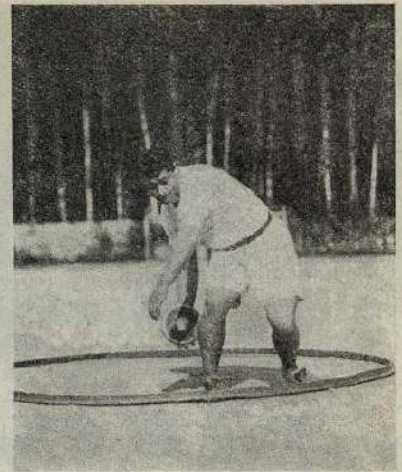
Американецъ Доридасъ демонстрируетъ въ М. К. Л. С. Метаніе диска.

Въ doubles: Дементьевъ 2-й—Томилинъ выиграла у Гозъ—Вишеръ (6:4, 6:2), Шписъ—Зейдель—у Струкова—Карпенко (6:1, 6:4), Ус-