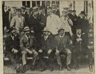
Члены клуба старшего клуба спорта в Орске на футбольных состязаниях 13-го мая 1912 года.

дней г. Шимань, выигравшей 2-й сетъ 5-4 и выигравшей 3-ью сетъ 5 игра против одной (первый сетъ был выигран Мюлькелом 6-4), но из-за слабо принужденной спешности отдала дальнейшей игре.