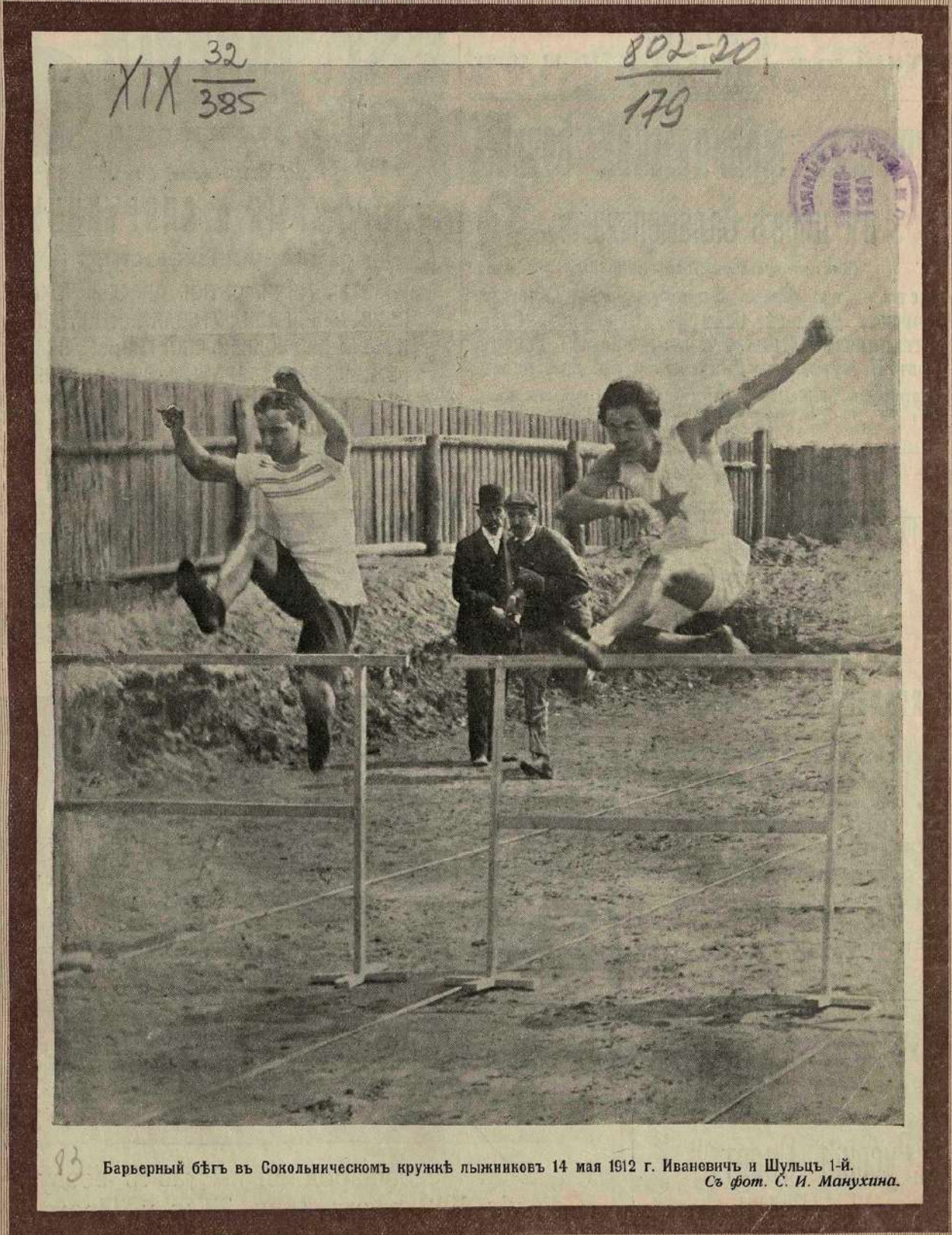
83 Барьерный бѣгъ въ Сокольническомъ кружкѣ лыжниковъ 14 мая 1912 г. Иваневичъ и Шульцъ 1-й.