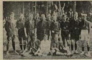
Финляндия на поле клуба спорта в Орске. Первый забитый гол.