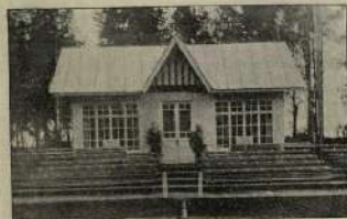
Павильон клуба спорта в Орске.