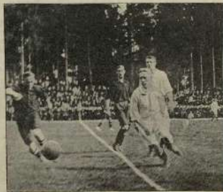
Во время матча 13-го мая 1912 г. в Орске.

Игра началась в 6 ч. 40 м. и с самого начала приняла быстрый темп. Мяч часто переходил от одного игрока к другому. И было несколько моментов, когда казалось, будет забит гол финнам. Но прекрасные пасы с краем, благодаря общей несыгранности москвичей, не позволяли центром, и голкипер финнов успевал их догнать или отбить в критический момент. На 8-й минуте к русскому голу прорвался Вистрем и забил первый гол. Забыв игра переносится опять к голу финнов.