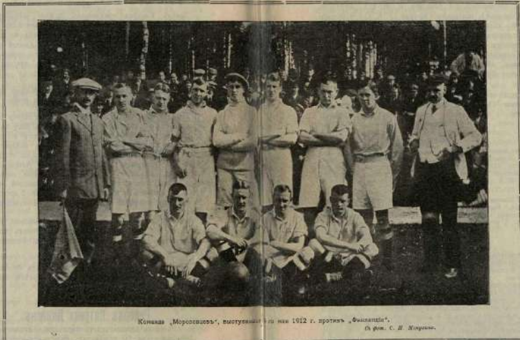
Команда «Моросовцы», выступившая 12 мая 1912 г. против «Финляндии».