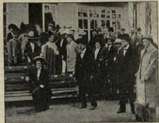
Публика на футбольных состязаниях в Орске-Зуеве 13 мая 1912 года во время матча Финляндия—«Моросовцы».