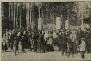
Публика сидит в клубе спорта в Орске 13 мая 1912 г. перед футбольным матчем.