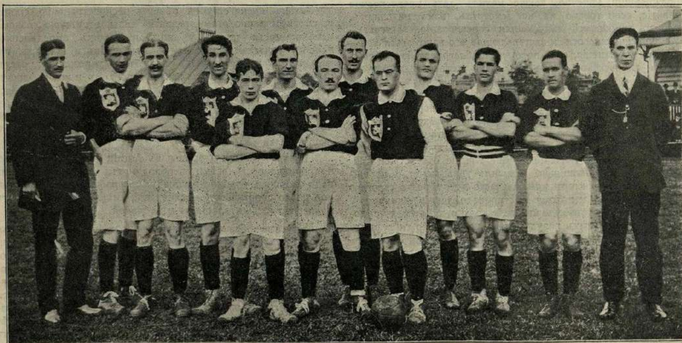
Сборная команда московской футбольной лиги, побѣдившая 29-го августа команду спб. кружка любителей спорта.

На основаніи вышесказаннаго я могу признать полезнымъ только такой видъ спорта, который укрѣпляетъ весь организмъ и при посредствѣ котораго можетъ быть достигнуто правильное, всестороннее физическое развитіе. Этому требованію отвѣчаютъ наиболѣе лыжный спортъ, гребной спортъ, плаваніе и легкая атлетика. По нашимъ климатическимъ условіямъ, первый можетъ имѣть мѣсто только зимой, а остальные три только лѣтомъ, потому что всякія занятія спортомъ въ закрытомъ помѣщеніи я считаю мало полезными (иногда даже прямо вредными) и потому возможными только въ крайнихъ случаяхъ, когда занятіе спортомъ на открытомъ воздухѣ положительно невозможно.