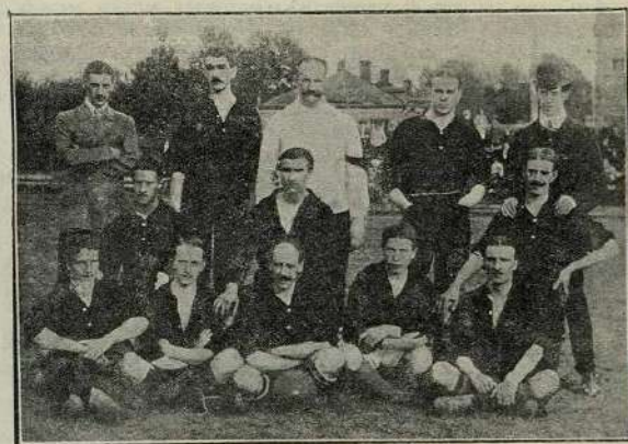
Первая команда Замоскворѣцкаго клуба спорта, побѣдившая 14 августа первую команду моск. клуба лыжниковъ.