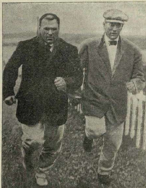
Гаккеншмидтъ (лѣвый) и его тренеръ на тренировочномъ бѣгѣ.

Въ программѣ открытыхъ состязаній слѣдуетъ отмѣтить интересныя эстафеты: олимпийская, назначенная на это воскресенье и