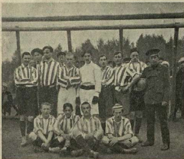
Первая футбольная команда „Быково“.

31-го іюля въ Вешнякахъ состоялся матчъ хозяевъ поля съ командой «Владычино», окончившійся въ пользу Вешняковъ, забив-