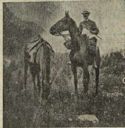
Капитанъ румынской службы Понъ, совершившій въ 58 дней путешествіе верхомъ на лошади изъ Бухареста въ Парижъ.

Болѣе 10.000 руб. выиграли слѣдующіе владѣльцы: