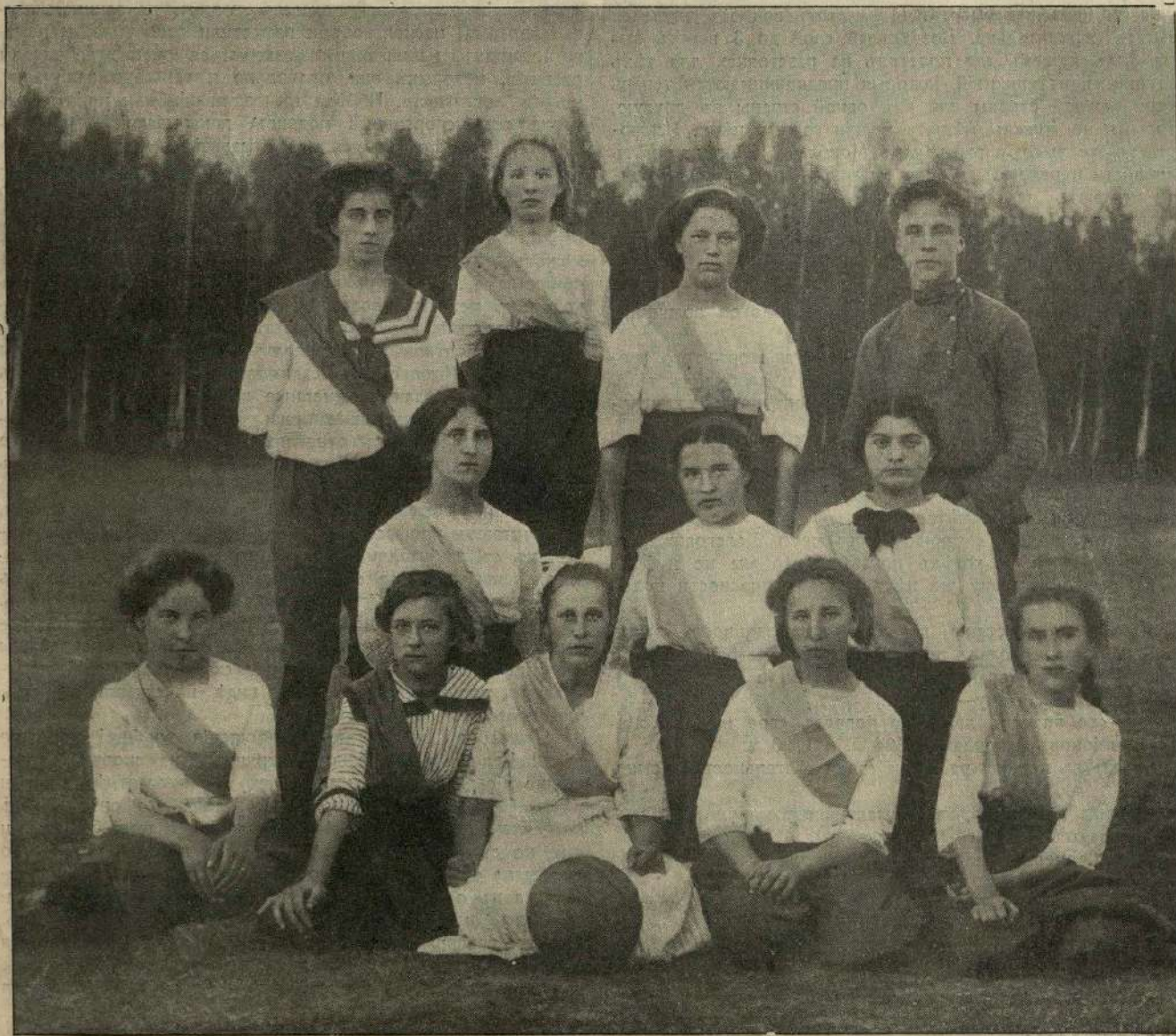
Первая женская футбольная команда „Пушкино“.