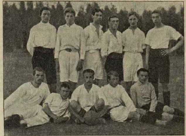
Первая футбольная команда „Пушкино“.

шихъ 4 сухихъ голей. Послѣ матча состоялся футбольный балъ, привлекиши много публики и прошедшій очень оживленно.