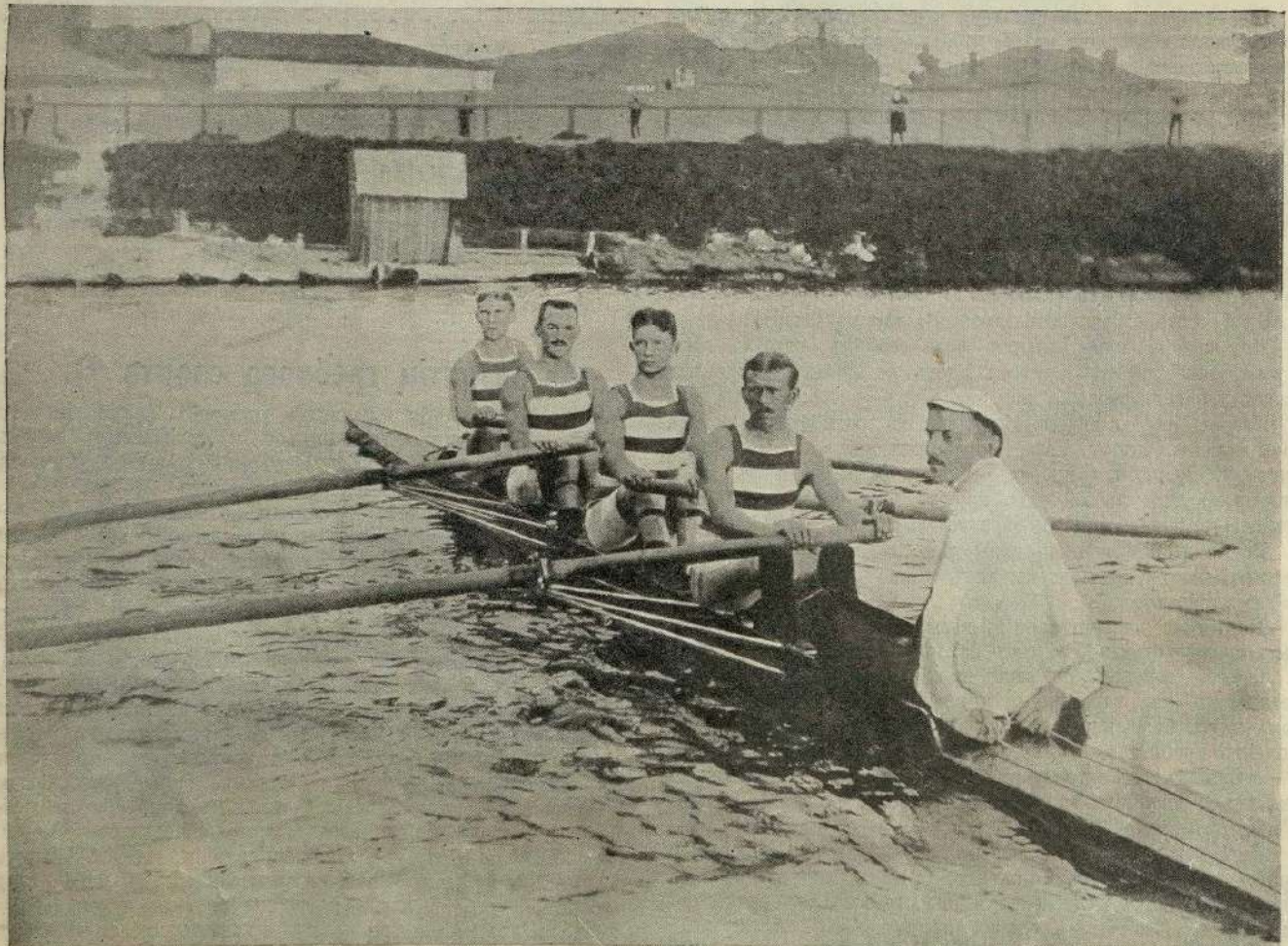
Четверка, выигравшая комитетскій призъ на гонкахъ 29-го іюня 1911 г. въ московскомъ рѣчномъ яхтъ-клубѣ. (См. № 36 „Русскаго Спорта“).