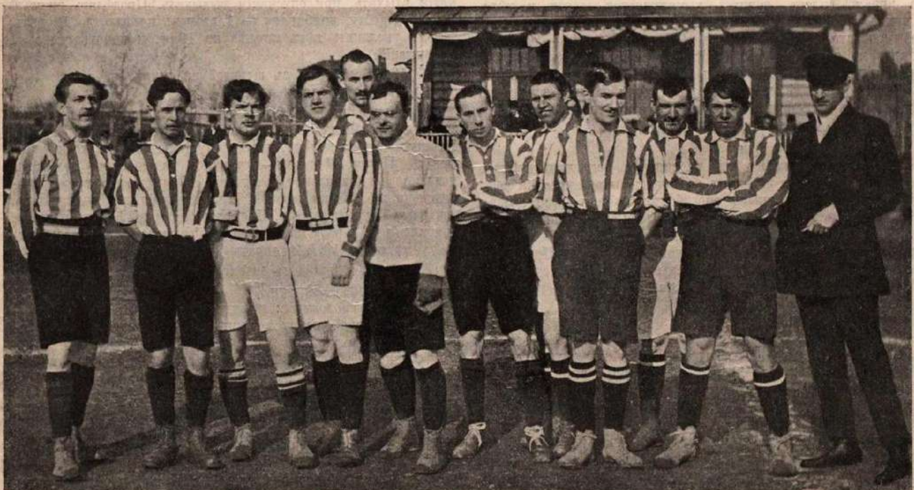
Русская сборная команда футболистовъ, выступающая въ матчъ противъ берлинской футбольной команды.

Начальное положеніе: штанга берется верхнимъ хватомъ (ладонями къ себѣ) на ширинѣ плечъ, корпусъ выпрямляется, локти прижаты къ бокамъ. I темпъ—сгибая руки (предплечья), поднять медленно штангу къ груди, оставляя локти на мѣстѣ. II темпъ—опустить штангу въ начальное положеніе.