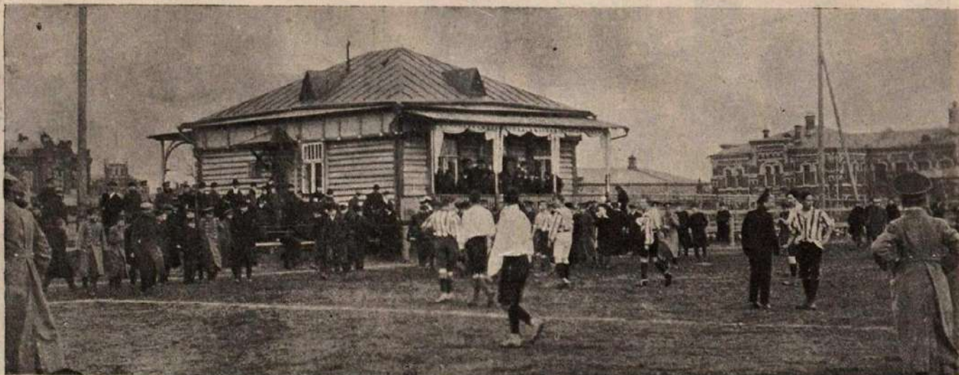
Состязанія 3-го апрѣля.—Во время перерыва.