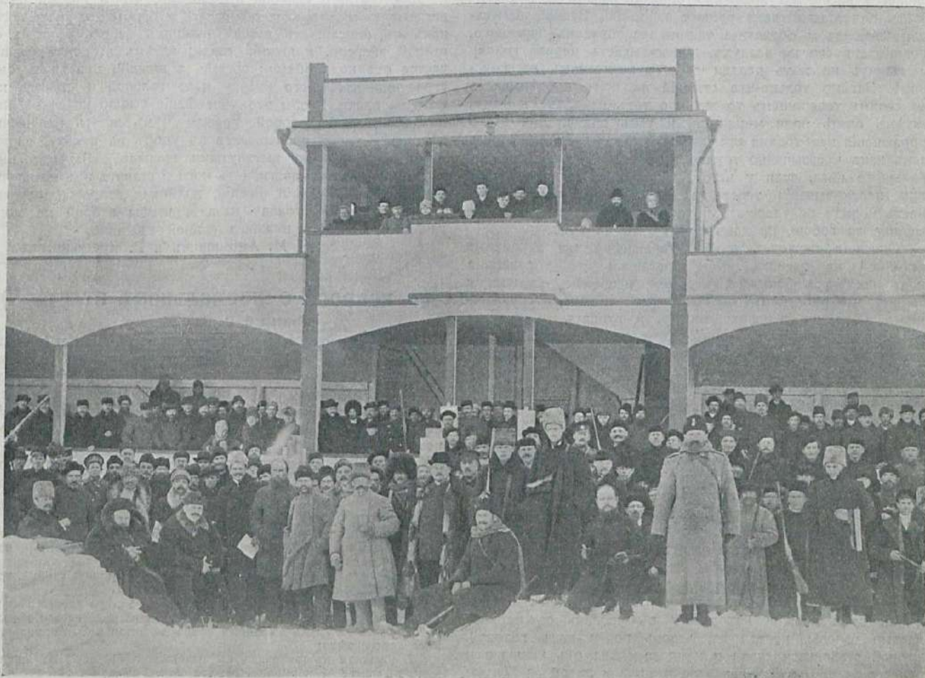
На стэндѣ Никольскаго общества охоты въ Орѣховѣ-Зуевѣ 18-го февраля 1911 года.

Затѣмъ то-же продѣлывается обратно и въ другую сторону. Кому удастся это упражненіе, тому уже не трудно будетъ продѣлать нѣчто въ родѣ сальтомортале, а именно: взявшись за руки, какъ и въ предыдущемъ упражненіи, второй подпрыгиваетъ вверхъ, подгибаетъ голову впередъ и переворачивается черезъ себя, держась все время за руки нижняго. Нижній же поддерживаетъ товарища въ моментъ вращенія на вытянутыхъ впередъ рукахъ. Какъ и