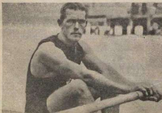
Чемпионъ міра по гребному спорту Рихардъ Арнетъ.

Футболъ. На спортивномъ митингѣ въ Іенѣ Вилли Краусу удалось бросить футбольный мячъ на дистанцію 63,45 м.