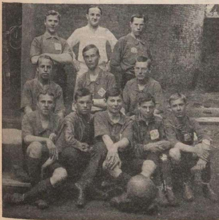
Футбольная команда московскаго клуба лыжниковъ.

Въ воскресенье, 15-го августа, состоялось открытіе осенняго футбольнаго сезона. На разныхъ поляхъ московской футбольной лиги состоялись матчи на кубокъ для первыхъ командъ имени Р. Ф. Фульда. Въ Орѣховѣ Морозовцы встрѣтились съ З. К. С., результатъ: 4:0 въ пользу Морозовцевъ, „Уніонъ“ съ Кружкомъ футболистовъ „Соколыники“ на полѣ „Уніона—0:8, проигралъ „Уніонъ“; во второй категоріи: „Вега“ съ З. К. С. 2 на полѣ послѣдняго—2:2 и на широкоей площадкѣ—московскій клубъ лыжниковъ съ „Новогиревымъ“—3:2 въ пользу лыжниковъ.