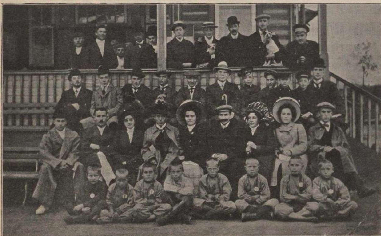
Группа устроителей, участниковъ и служащихъ.

Къ розыгрышу лаунъ-тенниснаго чемпионата города Москвы въ Сокольничьемъ клубѣ спорта.