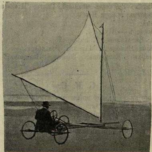
Этимъ лѣтомъ за границей вошло въ моду катаніе на четырехколесномъ легкомъ шасси на парусахъ. На этомъ рисункѣ изображена наиболѣе удачная модель аппарата этого типа.

Въ 1910 году въ Лоннахъ предполагается устроить Олимпійскія игры.