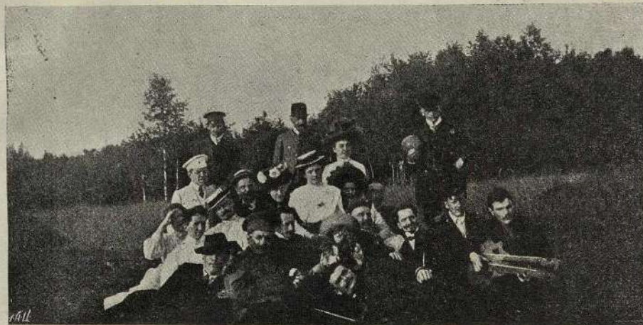
НА ЛОНЪ ПРИРОДЫ.