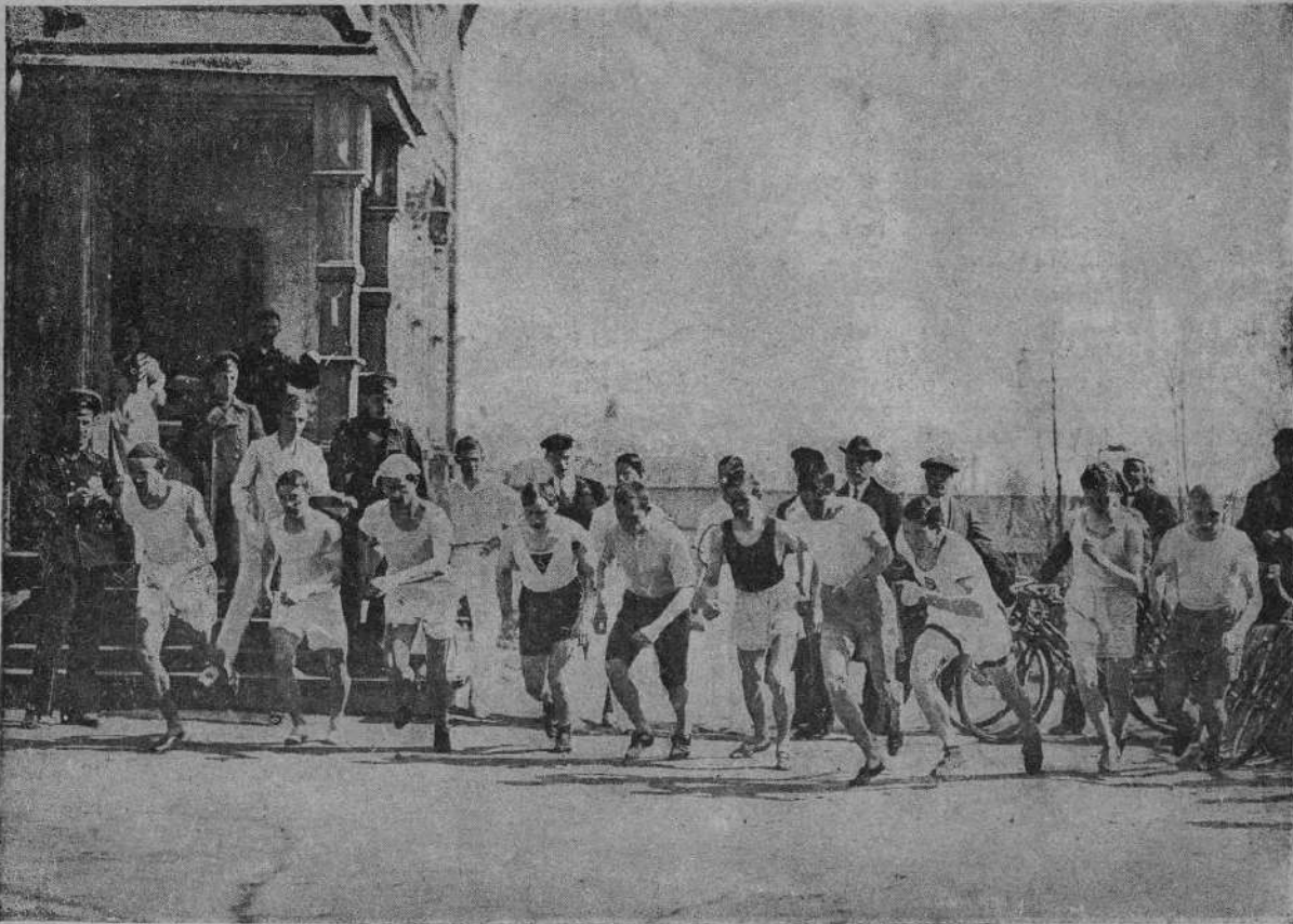
Стартъ участниковъ кроссъ-коунтра въ Московскомъ Клубѣ Лыжниковъ.