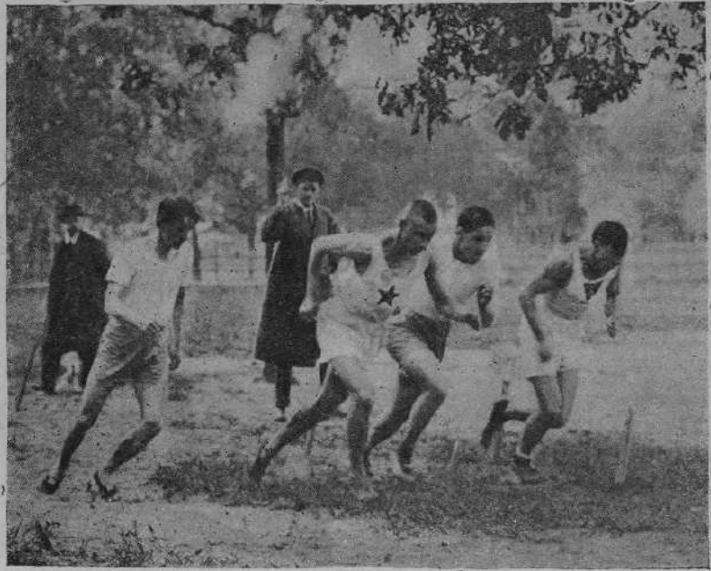
Старт бега на 400 метров в состязании 5-го июня на площадке «Санитас».

Матч первых команд «О-ва Люб. Лыжного Спорта» и «Баулинского кружка» в счете состязаний Казанской лиги на кубок Красково.