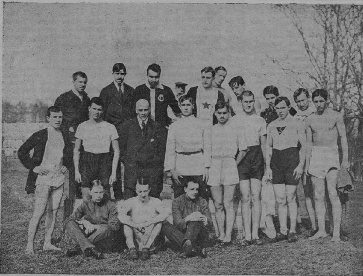
Группа легко-атлетовъ, тренировавшихся 3-го апрѣля въ Московскомъ Клубѣ Лыжниковъ.