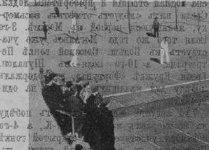
Летѣ въ 1920 году въ Москвѣ было совершено 60% побѣдъ... (Caption for the middle image, which appears to be a continuation of the text above it).