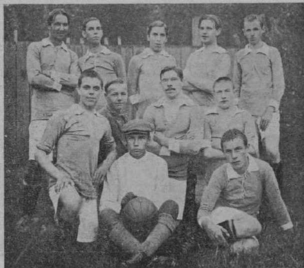
Первая команда Клинского кружка футболистов.