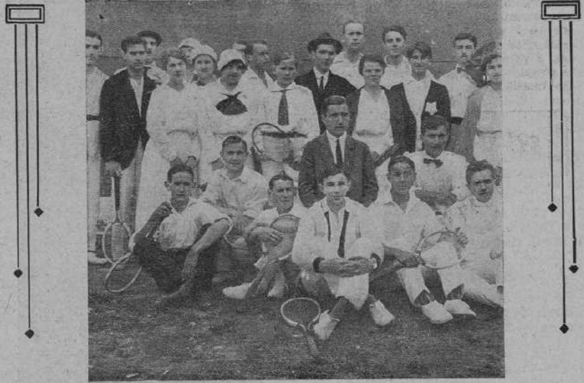
Группа лаунтенисистовъ Малаховскаго кружка спорта.