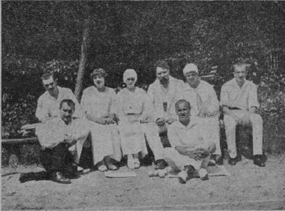
На кортах Васильевского кружка спорта.