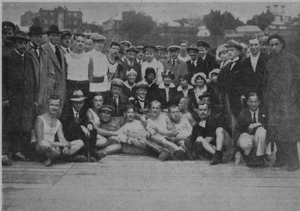
Общая группа участниковъ, судей и гостей, присутствовавшихъ на послѣднихъ гребныхъ состязаніяхъ въ М. О. Г. Л. и В. С.

Въ Московскомъ О-вѣ Горно-Лыжнаго и Воднаго Спорта.