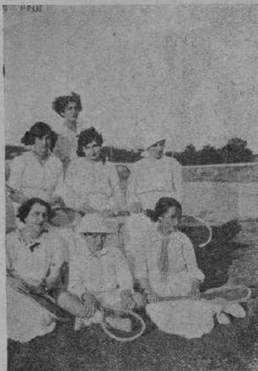
Группа теннисисток спорт. кружка «Вега» в Одессе.