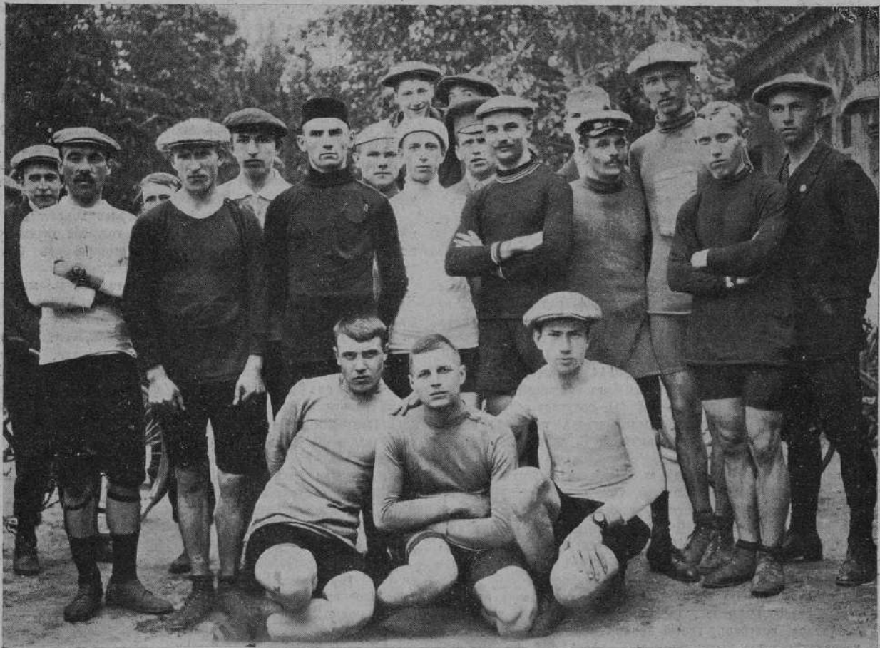
Общая группа участниковъ велосипедной гонки Тверь—Москва 29-го іюня.