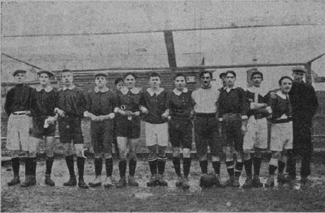
Команда спортивного кружка „глухонемых“ при об-ва имени И. К. Арнольда.

съ Солянским кружкомъ — 2:1 въ пользу того кружка; съ Прохоровским кружкомъ — 2:1 въ пользу глухонемых и реванш — 5:2 въ пользу прохоровцев; съ 2-й командой