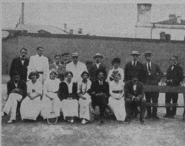
Общая группа петербургскихъ спортсменовъ.