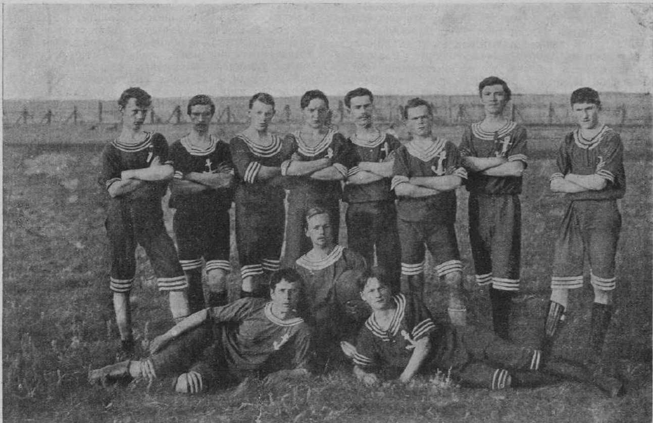
Команда г. Омска.