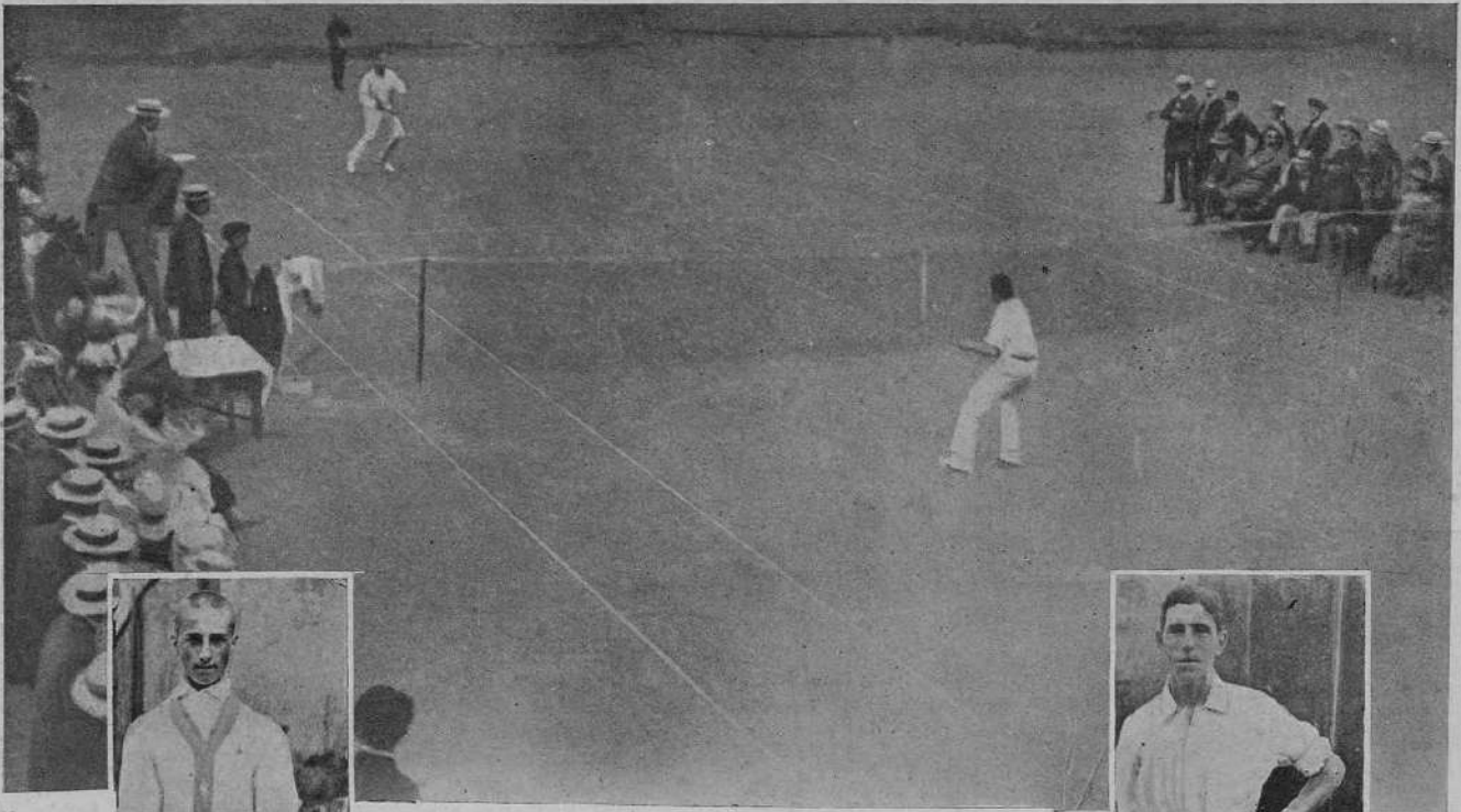
Состязаніе Сумаркова и Парбюрн.