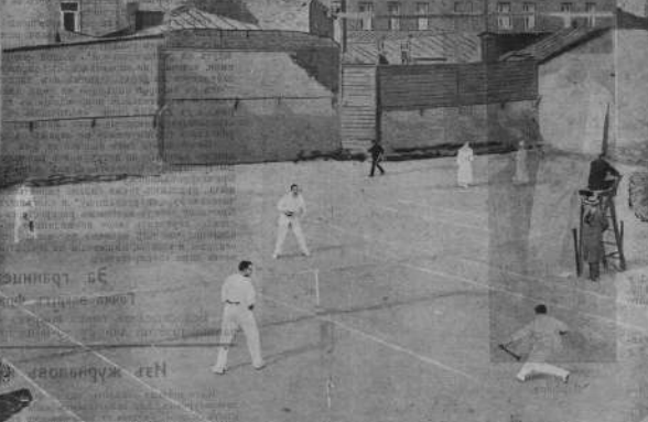
Состязание имело. Сумарокова 2-Алексеева и Лемингъ 1 и 5:6:1.

Въ парномъ парномъ, Гиршфельдъ и Моравскій выиграли у Сиверсъ и Манферсонъ 2:0, второй сетъ проиграла Сиверсъ и Манферсонъ 2:0.