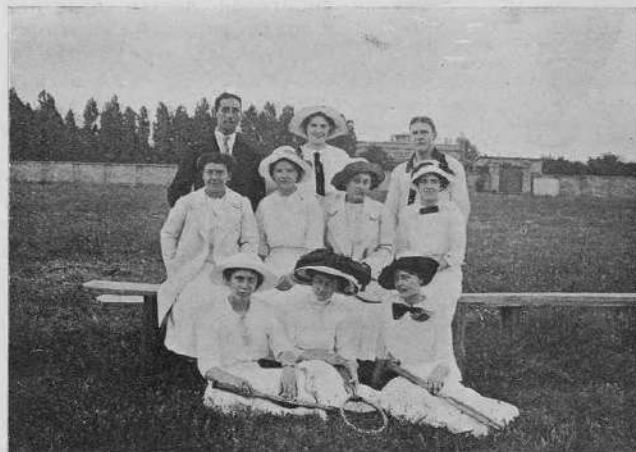
Члены Одесскаго британскаго атлет. клуба и Одесск. лаунъ-тен. кл. принимавшіе участіе въ дамскомъ interclub'ѣ. Побѣдили дамы Одесск. брит. атлет. клуба.