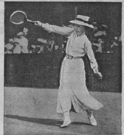
Г-жа Кери—второй призъ (Singles) на олимпійскихъ играхъ.

Въ слѣдующемъ № журнала „Къ Спорту!“ будетъ напечатана статья Розе „Олимпійская дипломатія“.