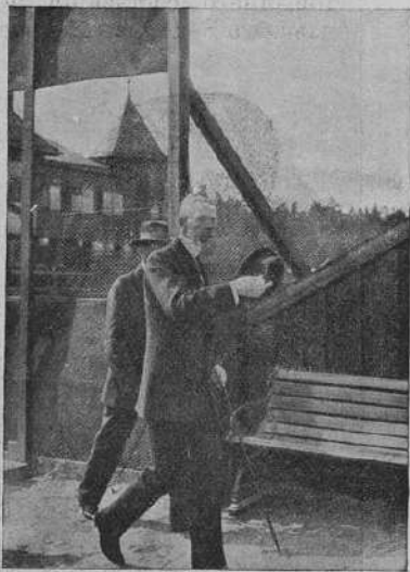
Шведскій король идетъ на состязаніе въ лауфъ-тенисъ.

Послѣ забѣговъ ожидали на мѣсто и другого Колехмайнена — Тату, брата Ханеса, такъ какъ ими было показано отличное время. Финальное время нѣкоторыми считается мировымъ рекордомъ. Очевидно забываютъ о времени 30 мин. 58,8 сек., показанномъ Ж. Буеномъ осенью прошлаго года, въ часовомъ бѣгѣ.