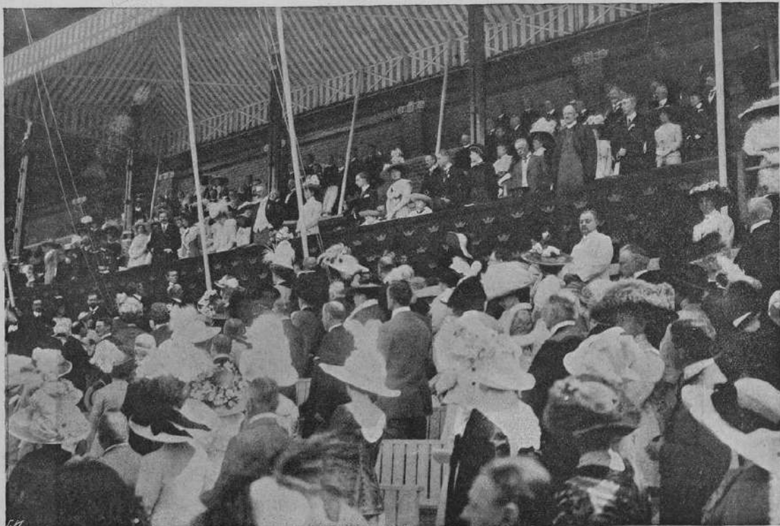
День открытія стадиона. Въ королевской ложѣ король (въ бѣломъ жилетѣ); по правую его руку—королева и по лѣвую—Велик. Кн. Дмитрій Павловичъ и кронпринцесса съ дѣтьми.