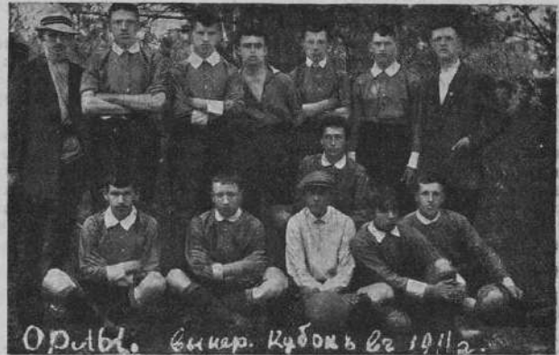
Орлы. Феникс. Кречеть в 1912.