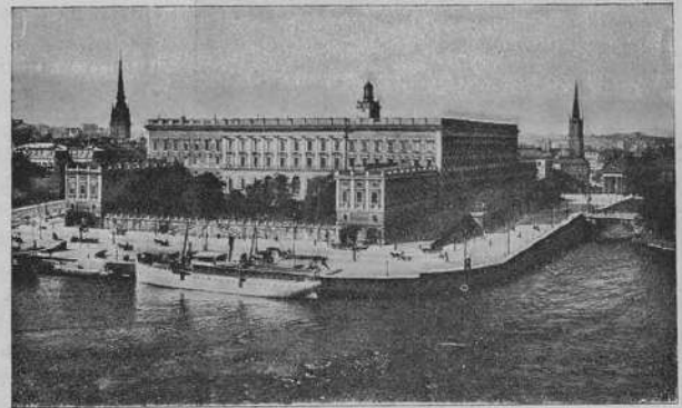
Королевскій дворецъ въ Стокгольмѣ, на Garden Party, въ которомъ были приглашены представители олимпійскихъ комитетовъ всѣхъ странъ. Приглашенные собрались въ саду. Король, королева, кронпринцъ, Велик. кн. Марія Павловна, Велик. кн. Дмитрій Павловичъ обходили гостей и бесѣдовали съ ними.

Прыжки, метанія и командныя состязанія въ слѣдующемъ №.