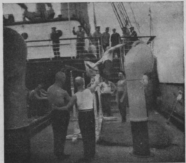
Гимнастическія упражненія русскіхъ офицеровъ на палубѣ „Бирмы“.