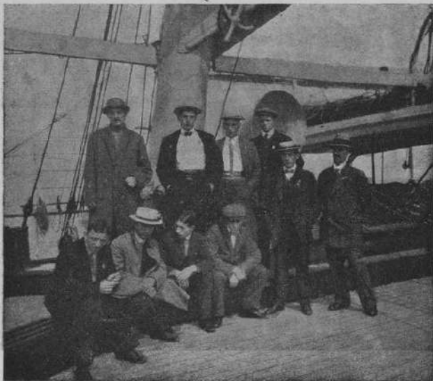
Русскіе спортсмены на палубѣ „Бирмы“.