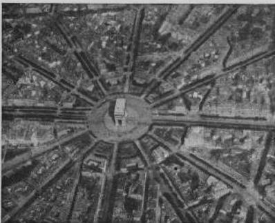
Париж. Триумфальная арка. Вид с высоты с дрикебака.

только все поле во всю ширину и длину, и все окрестности полны рвануть — это здесь, нужно взглянуть на рисунок и ужаснуться, увидев размах праздника.