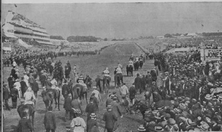
На старт при розыгрыше Эпсомского дерби.