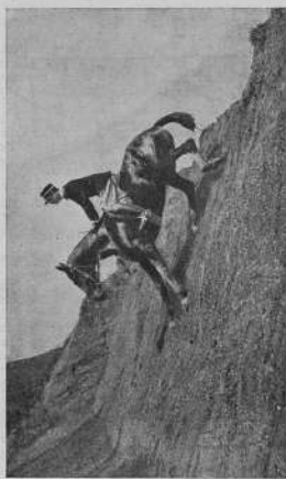
Узда итальянской кавалерии: Спуск с обрыва.