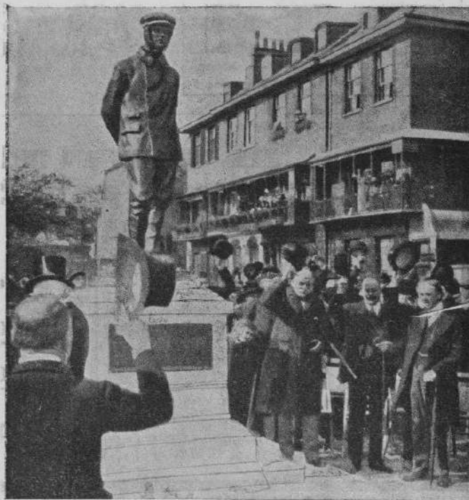
Памятникъ авіатору Рольсу, погибшему при перелетѣ черезъ Ламаншъ.

Жюри подтверждаетъ побѣду. Публика срывается съ мѣста. Нѣсколько разъ Шарпантье несутъ на рукахъ вокругъ ринга. Триумфъ полный. Даже побѣжденный Вилли Левисъ въ дружескомъ порывѣ обнимаетъ побѣдителя.