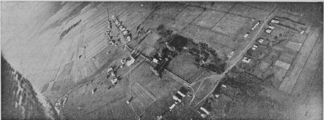
Надъ деревней Хрипково, Сѣвскаго уѣзда, Орловской губ.