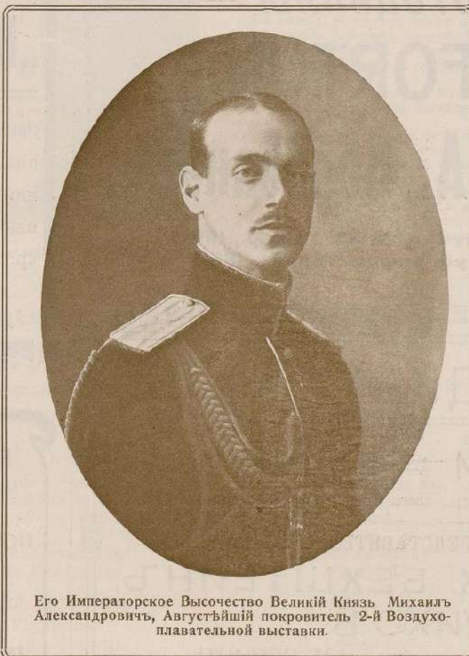
Его Императорское Высочество Великій Князь Михаилъ Александровичъ, Августѣйшій покровитель 2-й Воздухоплавательной выставки.

Нѣтъ. Пожелаемъ же этому съѣзду большаго успѣха и большей продуктивности въ его работахъ.