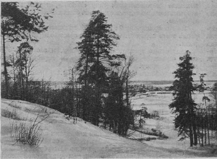
Подъ Звенигородомъ лыжники любовались такими живописными панорамами...