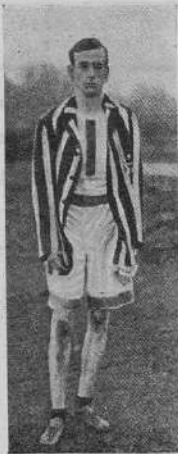
Портеръ, побѣдитель кроссъ-коунтри.

Въ West Kensington'ѣ состоялось очень интересное состязаніе между командами Оксфордскаго и Кембриджскаго университетовъ.